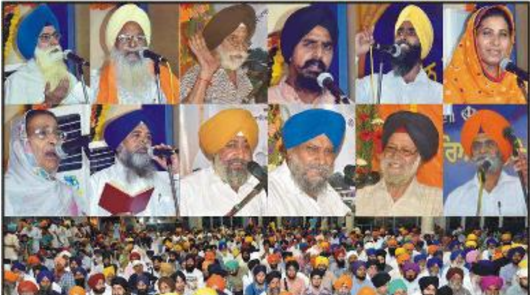
ਸ੍ਰੀ ਗੁਰੂ ਰਾਮਦਾਸ ਜੀ ਦੇ ਪ੍ਰਕਾਸ਼ ਪੁਰਬ ਨੂੰ ਸਮਰਪਿਤ ਗੁਰਦੁਆਰਾ ਸ੍ਰੀ ਮੰਜੀ ਸਾਹਿਬ ਦੀਵਾਨ ਹਾਲ ਵਿਖੇ ਆਪਣੀਆਂ ਵੱਡਮੁੱਲੀਆਂ ਰਚਨਾਵਾਂ ਰਾਹੀਂ ਵੱਖ-ਵੱਖ ਕਈ ਗੁਰ-ਇਤਿਹਾਸ ਪੰਛ ਕਰਦੇ ਹੋਏ। ਹੇਠਾਂ: ਸਮਾਗਮ ਵਿਚ ਸ਼ਮੂਲੀਅਤ ਕਰਦੀਆਂ ਹੋਈਆਂ ਸੰਗਤਾਂ।